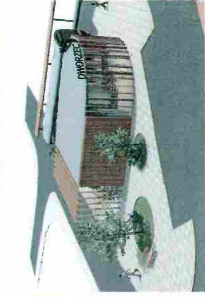
Program Funkcjonalno-Użytkowy, Koncepcja Dworca Autobusowego w Paczkowie