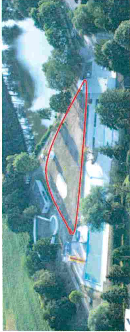
Zagospodarowanie terenu basenu miejskiego