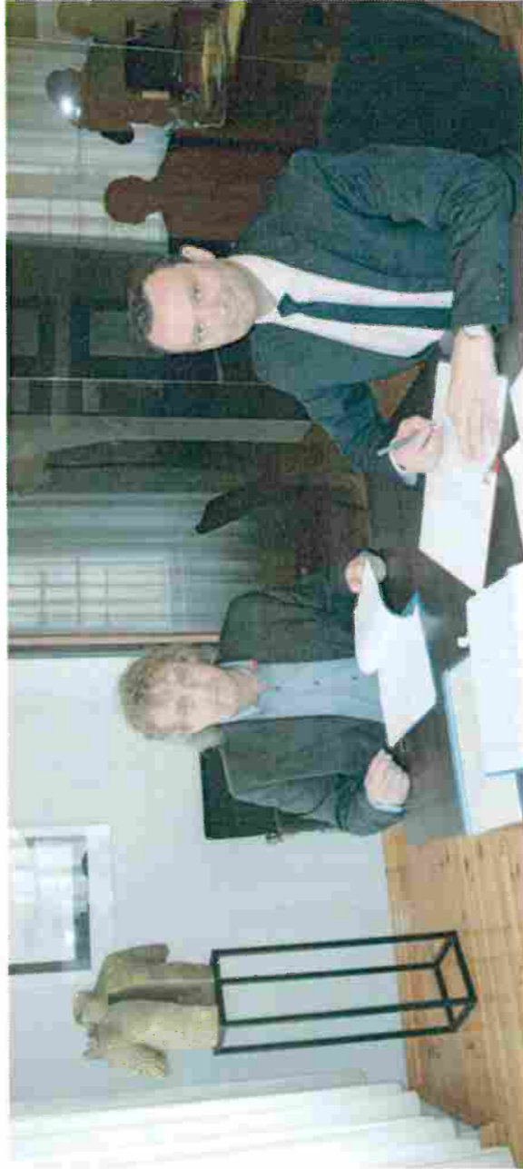
Podpisanie umowy o dofinansowanie projektu „Paczków i Javornik. Dwa miasta, jedna historia”