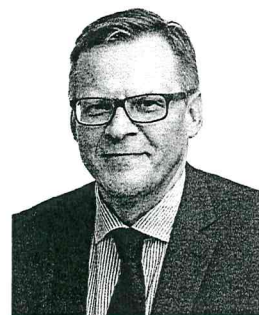
PREZES KASY ROLNICZEGO UBEZPIECZENIA SPOŁECZNEGO